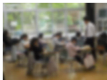
4 年 生