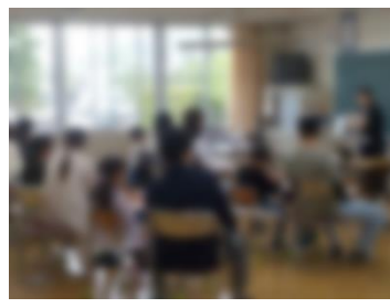
3 年 生