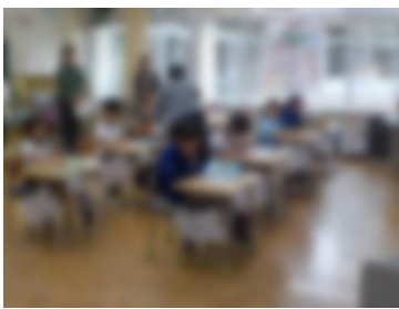
2 年 生