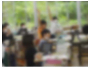
5 年 生