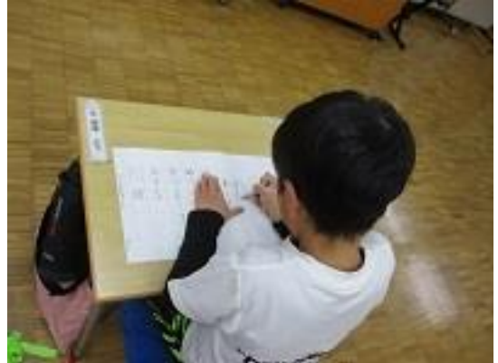
1年生と2年生は硬筆